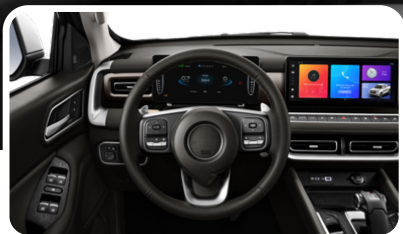
Volante de cuero multifunción con cambio de levas