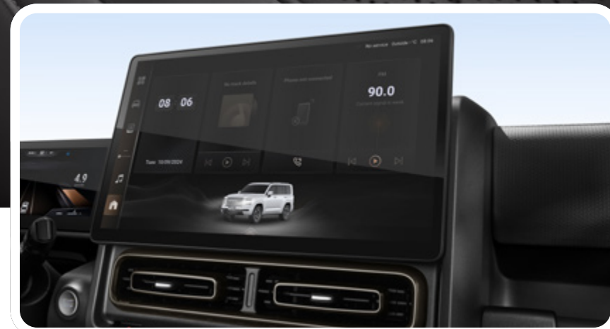
Pantalla táctil de 14.6" y cámara panorámica de 360°

*Las imágenes mostradas son a modo de referencia y pueden diferir del vehículo final. *Versiones sujetas a disponibilidad.* Features disponibles dependen de la versión.