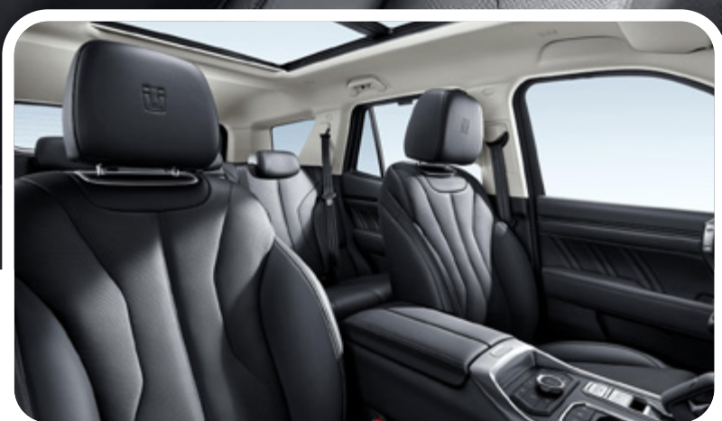
Asientos de cuero Nappa con ventilación y calefacción