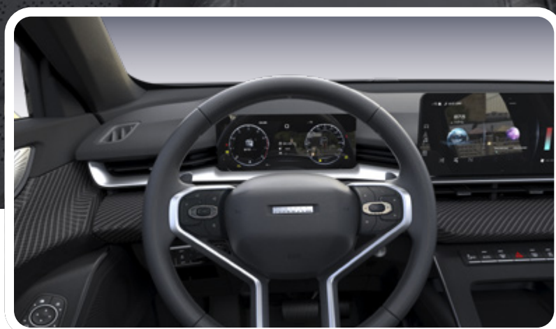
Tablero digital full LCD de 10.25"