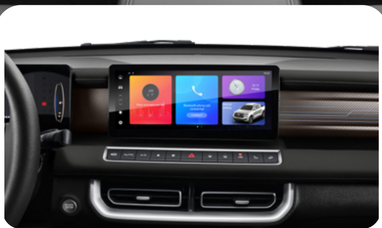
Pantalla multimedia de 12.3"