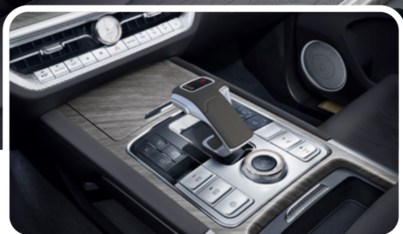
Palanca de cambios electrónica con diseño moderno

Tracción 4x4 con bloqueo de diferenciales