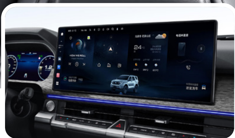
Pantalla multimedia de 16.2" y cámara de visión 360° HD