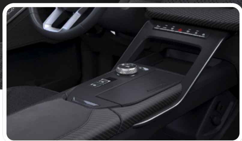
Perilla de cambios electrónica con diseño minimalista