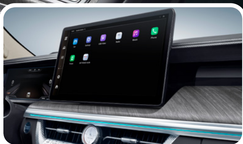
Pantalla multimedia de 14.6" con interfaz de lujo