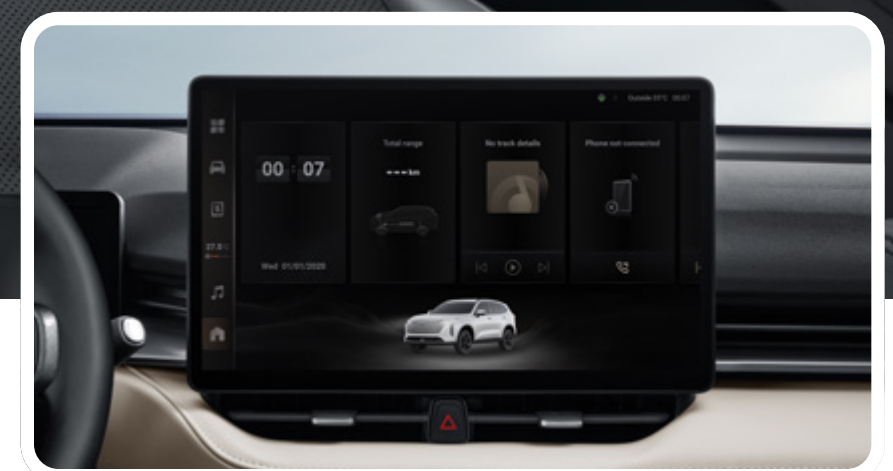
Tablero digital full LCD de 14.6"