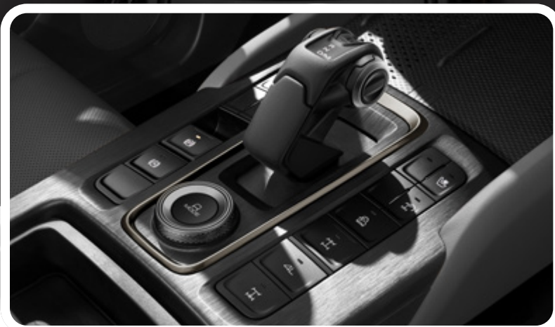
Bloqueo de diferencial electrónico trasero