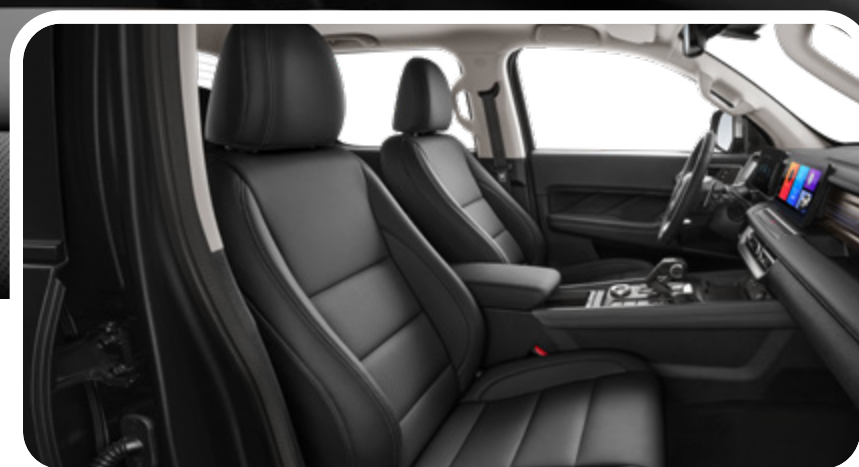
Asientos de polipiel con ajuste manual