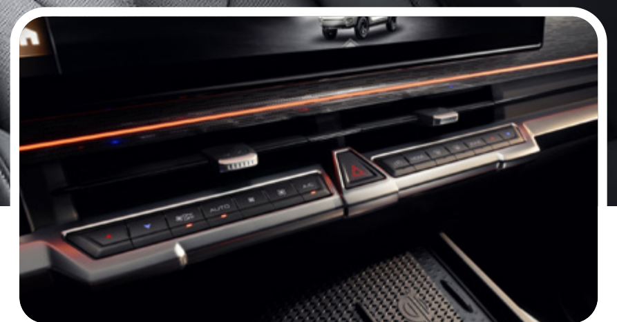
Aire acondicionado de doble zona y cargador inalámbrico doble

*Las imágenes mostradas son a modo de referencia y pueden diferir del vehículo final. *Versiones sujetas a disponibilidad. * Features disponibles dependen de la versión.