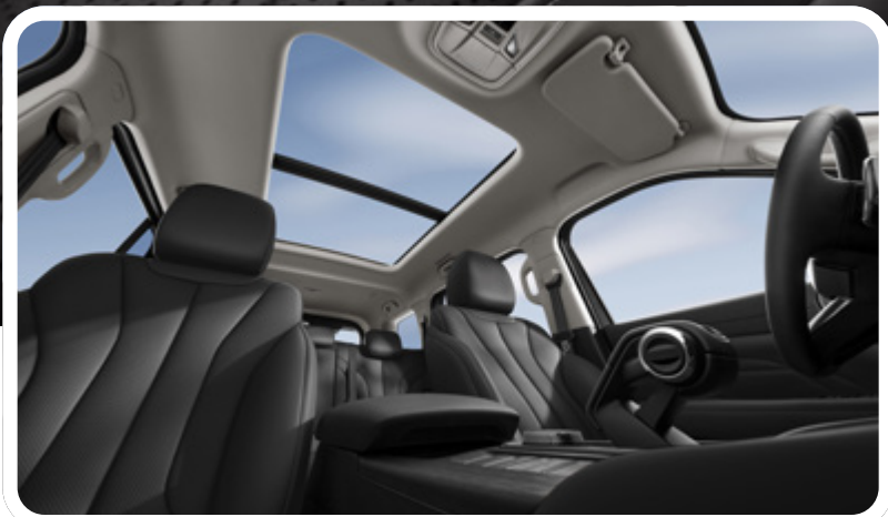
Asientos delanteros con ventilación y función de masajes

Control de cruceo adaptativo inteligente y Todoterreno