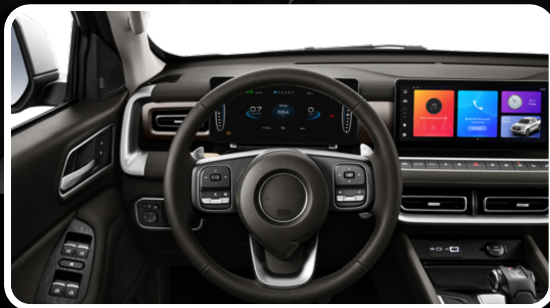
Volante de cuero multifunción con cambio de levas