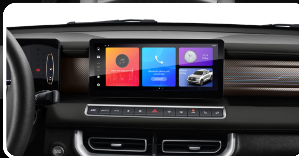
Pantalla multimedia de 12.3"