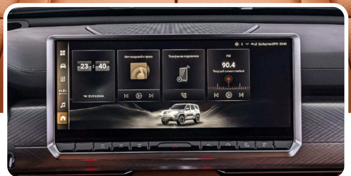
Pantalla multimedia de 16.2" con cámara de visión panorámica de 360° HD