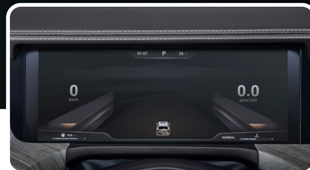
Tablero digital full LCD de 12.3" con personalización