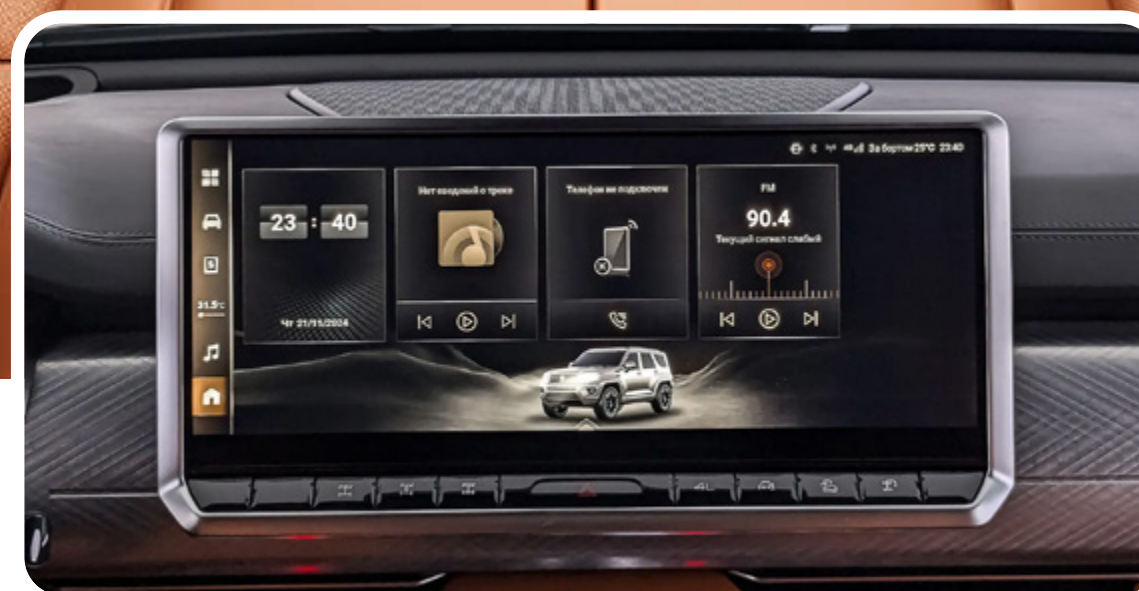
Pantalla multimedia de 16.2" con camara de vision panoramica de 360° HD