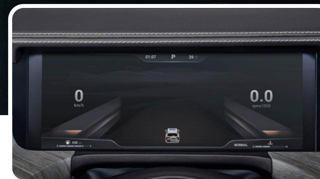
Tablero digital full LCD de 12.3” con personalización

*Las imágenes mostradas son a modo de referencia y pueden diferir del vehículo final. *Versiones sujetas a disponibilidad.