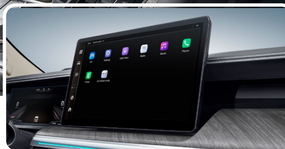
Pantalla multimedia de 14.6” con interfaz de lujo