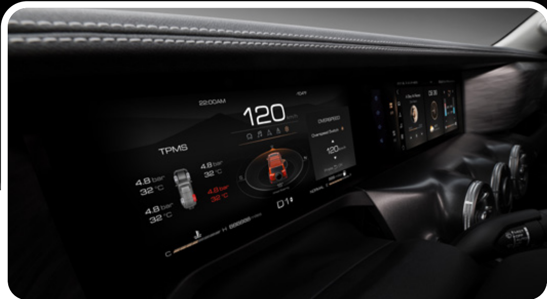
Tablero digital LCD de 12.3” con información 4x4

*Las imágenes mostradas son a modo de referencia y pueden diferir del vehículo final. *Versiones sujetas a disponibilidad.