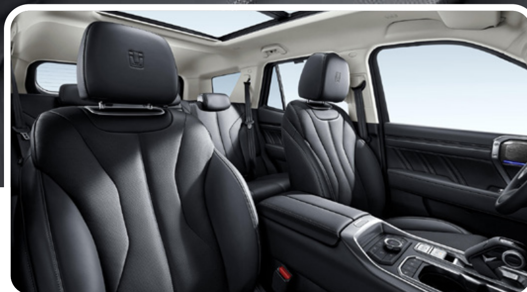
Asientos de cuero Nappa con ventilación y calefacción