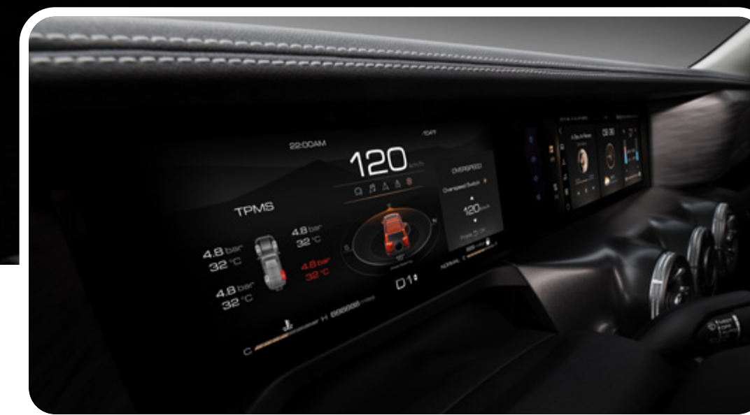
Tablero digital LCD de 12.3" con información 4x4

*Las imágenes mostradas son a modo de referencia y pueden diferir del vehículo final. *Versiones sujetas a disponibilidad.