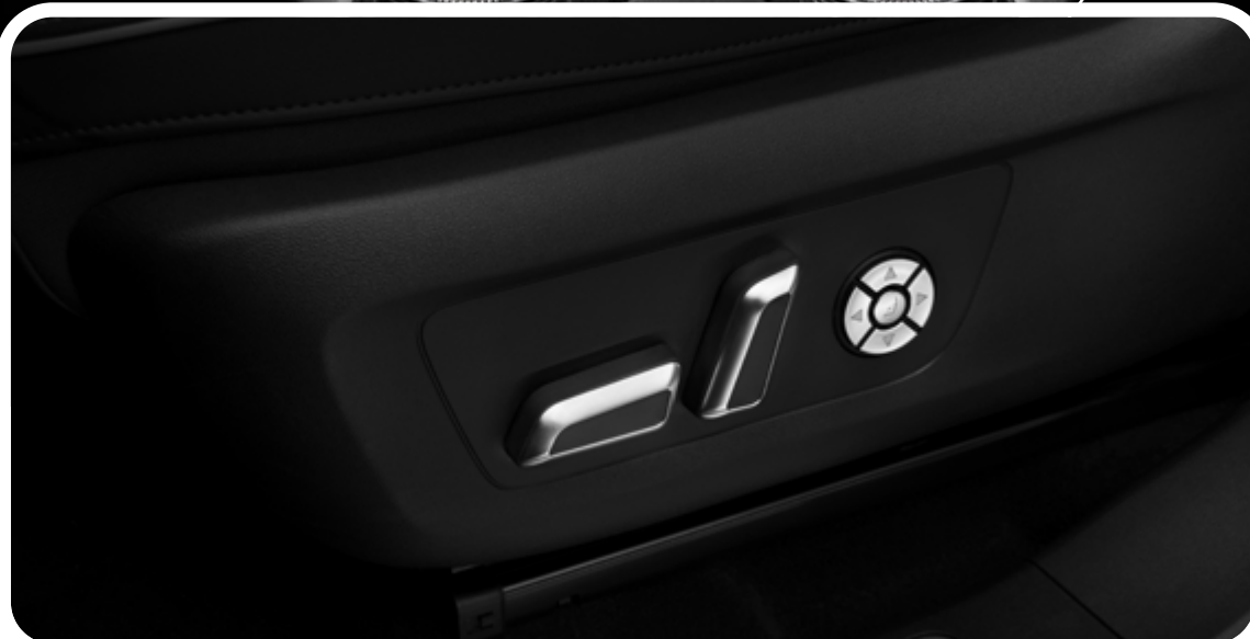
Asientos de cuero con ajuste eléctrico y memoria