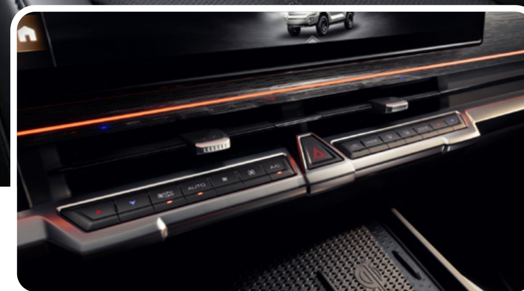
Aire acondicionado de doble zona y cargador inalámbrico doble

*Las imágenes mostradas son a modo de referencia y pueden diferir del vehículo final. *Versiones sujetas a disponibilidad.