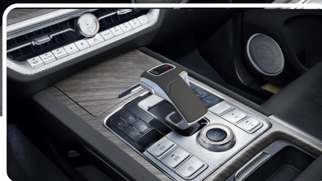
Palanca de cambios electrónica con diseño moderno

Tracción 4x4 con Bloqueo de Diferenciales.