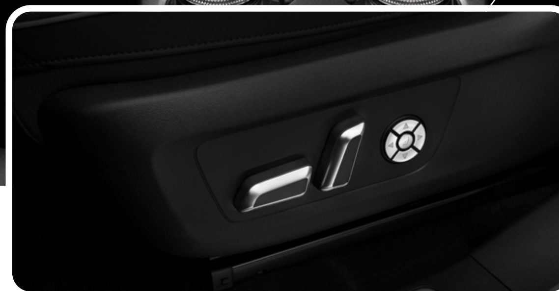
Asientos de cuero con ajuste eléctrico y memoria