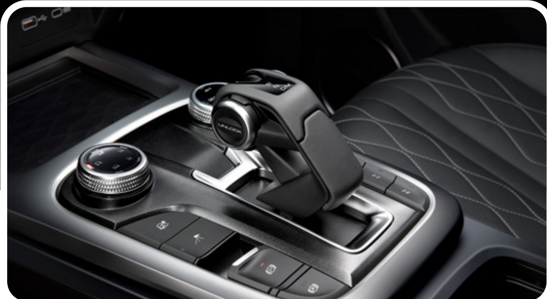
Palanca de cambios electrónica con diseño Off-Road

Tracción 4x4 con bloqueo de diferenciales.