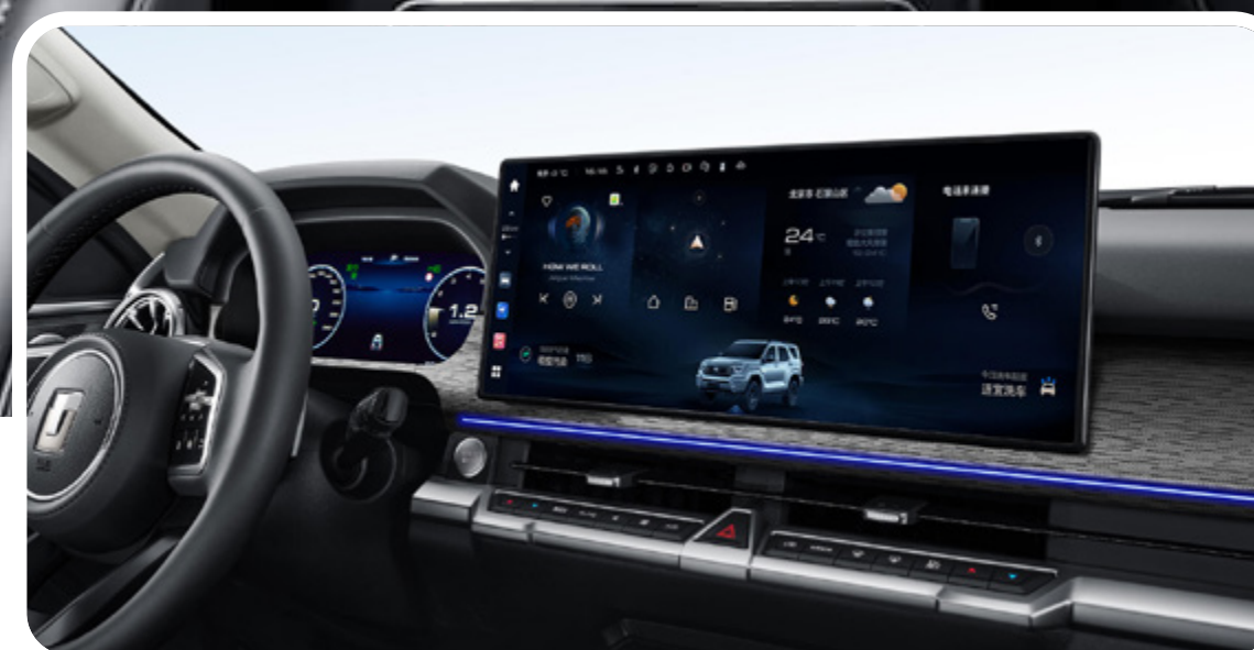
Pantalla multimedia de 16.2" y cámara de visión 360° HD